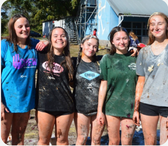
1 NIEUWE LEIDING DIE WERD INGEDOOPT