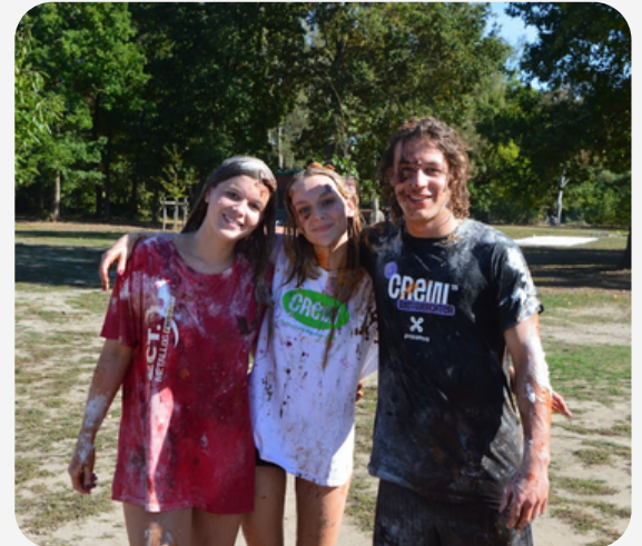
3 OUD-LEIDING DIE WERD UITGEDOOPT